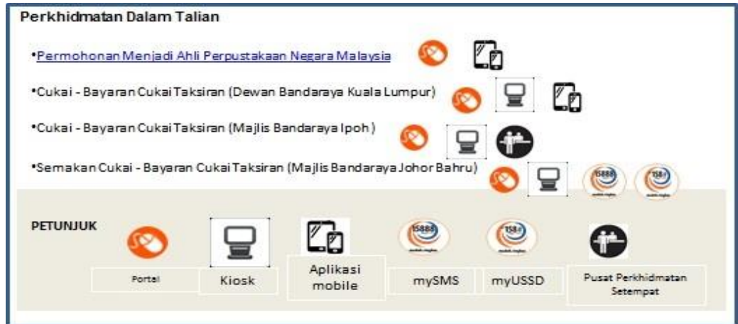
Rajah 4: Ikon Perkhidmatan Pelbagai Saluran